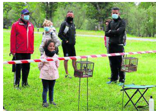
Un instante de la jornada de ayer en la Isla del Soto. MARÍA M. SERNA

Este concurso forma parte de la Olimpiada de Cultura Clásica, organizada por la sección de Salamanca, Ávila y Zamora de la Sociedad Española de Estudios Clásicos, que está destinada a alumnos de Educación Secundaria y Bachillerato y promueve el conocimiento sobre las lenguas y cultura de la Antigüedad griega y romana.