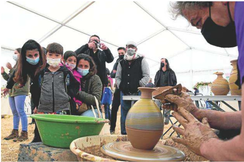
◀ Varias personas siguen atentas cómo se elabora una pieza de alfarería.

▶ Además de talleres de elaboración de quesos y cuajada, también hubo cata de quesos.