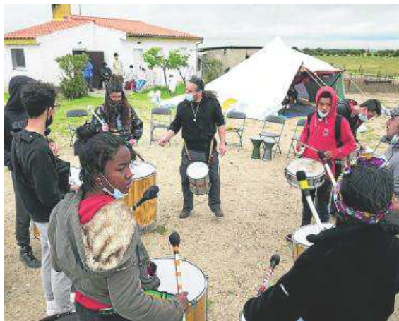
Batukada, una forma de animar el medio rural.