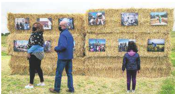
La jornada también incluyó una exposición de fotografías.