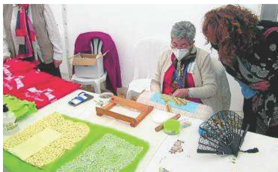
Demostración de la elaboración de encaje de bolillos.