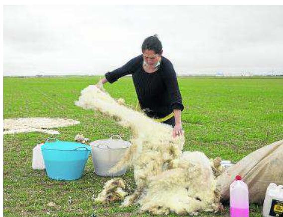
La lana fue la protagonista de una expresión artística en el campo.

rar oficios perdidos o a punto de desaparecer» y también la importancia del oficio de los pastores, un «trabajo muy digno», que viene de «nuestros antepasados» y que cuenta con una gran sabiduría popular.